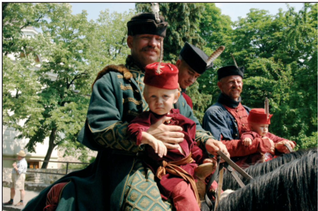
Huszonkét társaság, egyesület, rend, alapítvány, történelmi és néptáncsoport vett részt a füredi Korok fesztiválján

Május utolsó napján, a Kossuth téren és környékén megjelentek a honfoglalók, és a táltos dobosok. Nem sokkal később megérkeztek a páncélba öltözött magyar vitézek, íjászok, kardforgatók, páncélosok, ágyút vivők. Eljöttek Mátyás király lovagjai, a kurucok, a barokk kor képviselői, a reneszánszot, a reformkort idézők, és a huszárok is. A Balatonfüredi Reformkori Hagyományörzők Társasága május 31-én és június 1-én második alkalommal rendezte meg a Korok Fesztiválját.