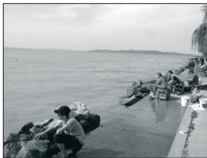
Mindig nagy az érdeklődés a diák horgászverseny iránt