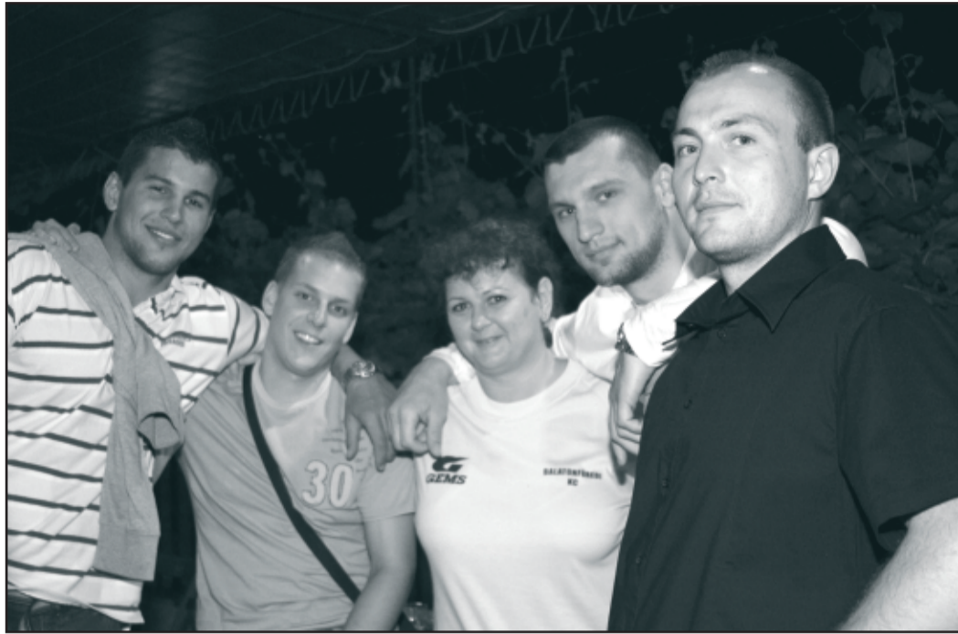
Óriási bulit rendeztek a kézisek a győztes évadzáró meccs után. A képen néhányan a csapatból a Grillkertben

alapszakaszából. Maximálisan elégedett vagyok a csapat teljesítményével, hiszen tavasszal volt egy négy hónapos veretlenségi sorozatunk, mindössze egyszer kaptunk ki Tatabányán, ahol a fél csapat lesérült. Ha az alapszakaszban egy kicsit hamarabb összeállunk, ak-