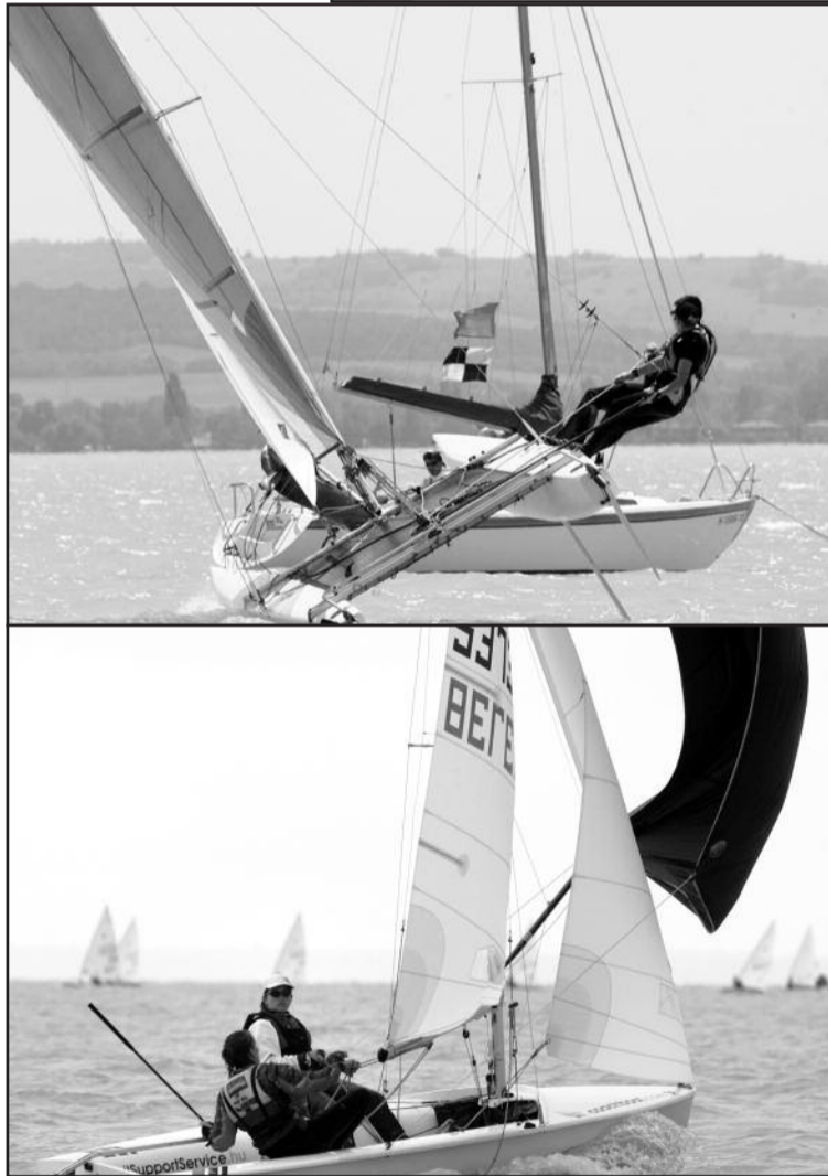
A füredi vitorlázóklub hosszú évek óta élén jár az utánpótlásképzésben

százalékos Európai Unió támogatással felújítják a belső kikötőt. A mintegy 90 millió forintos fejlesztés során harmincöt centiméterrel megemelik a partszakaszt, mely faboritást kap. Internet lehetőséget is biztosítanak majd, továbbá az építkezés során gondolkodnak a mozgássérültekre is, hogy ők is megközelíthessék a partszakaszt. A komplett nyugati részt lebontják, helyére újat építenek. A műemlék jellegű árbócdarut felújítják, eredeti állapotába visszaállítják. A beruházás előreláthatólag szeptember közepén kezdődik meg és amennyiben megfelelő lesz az időjárás, november végén befejeződik. Tavaly a Radnóti és az Eötvös iskolákkal írtak alá megállapodást, miszerint a klub vállalja a diákok részére a vitorlás oktatást. A fiatalok hetente egy alkalommal élhetnek ezzel a lehetőséggel, sőt idén már a Lóczy gimnázium növendékei is csatlakoztak ehhez a kezdeményezéshez. Az ügyvezető sikeresnek ítéli meg mindezt, hiszen jó néhány tizenéves már versenyszerűen űzi ezt a sportágat.