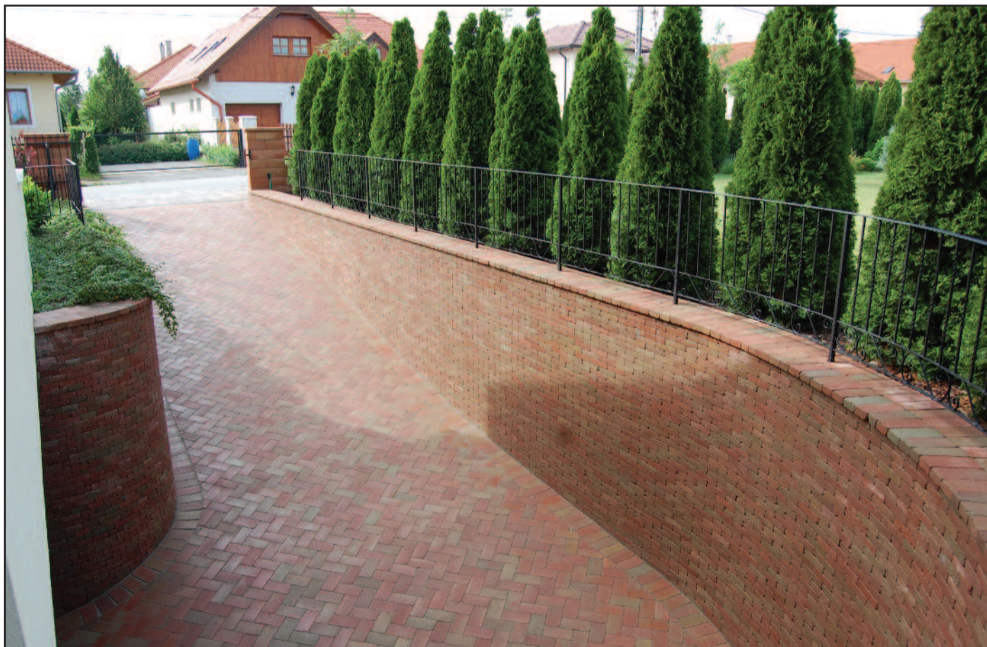
A téglakő immár építőelem