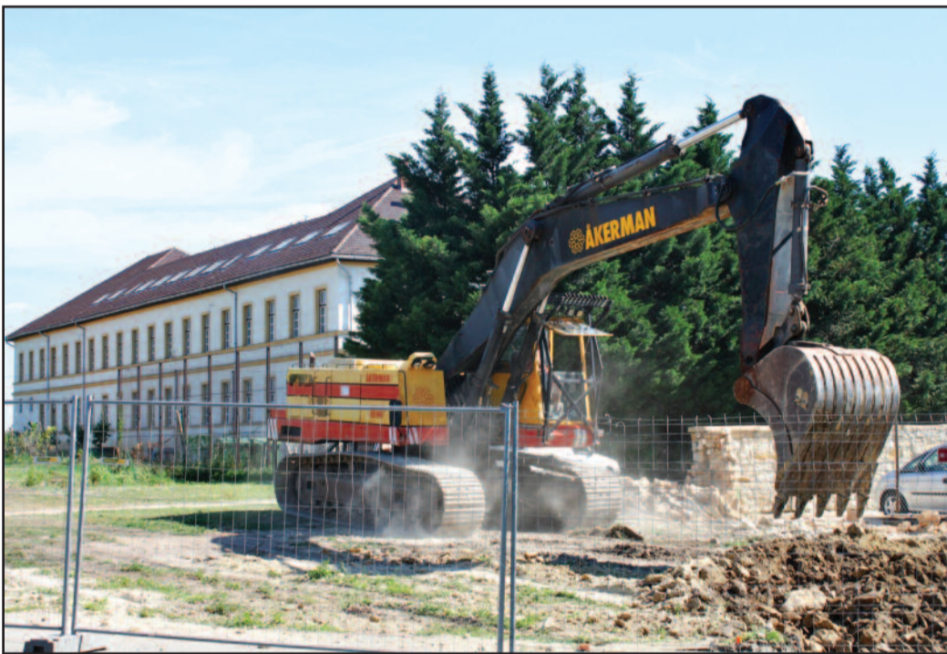
Megkezdődött a mélygarázs építése a városközpont rehabilitációs program keretében