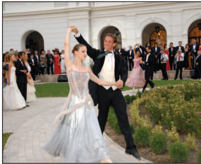
A város idén is meghívta a 18. évüket betöltött fűredi lányokat a bálra, akik közül 15-en el is fogadták a meghívást