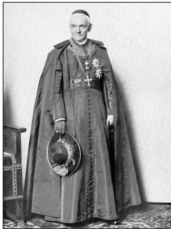
Vaszary Kolos hercegprímás utolsó éveit Füreden töltötte

A család igazi nagy története Vaszary Kolossal kezdődött. A hétgyermekes családból szá-