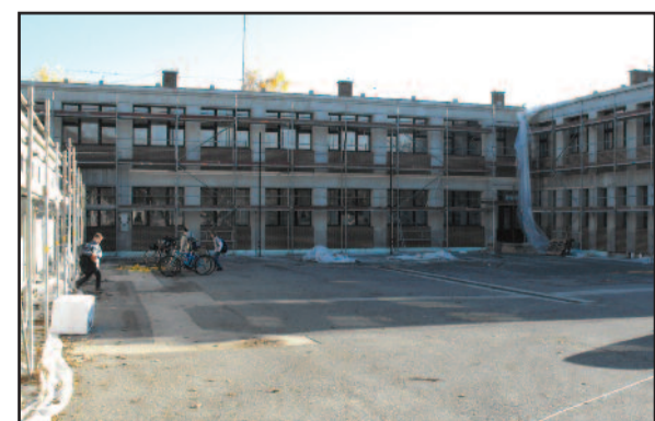
Az Eötvös és a Radnóti iskola homlokzata is hőszigetelést kapott

cserélni. Az Eötvös Loránd Általános Iskolában is pár éven belül megtérülő kondenzációs kazánt építettek be, ugyancsak szigetelték az épületet, és a