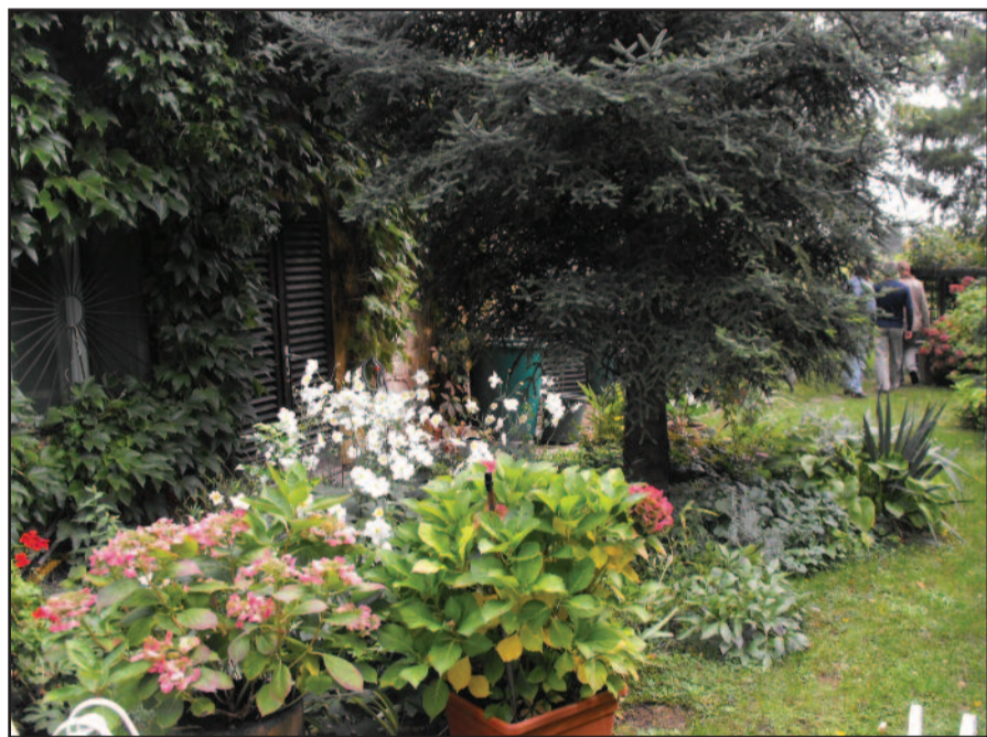
Már-már buja, nagyon hangulatos kert lett az Év kertje Füreden