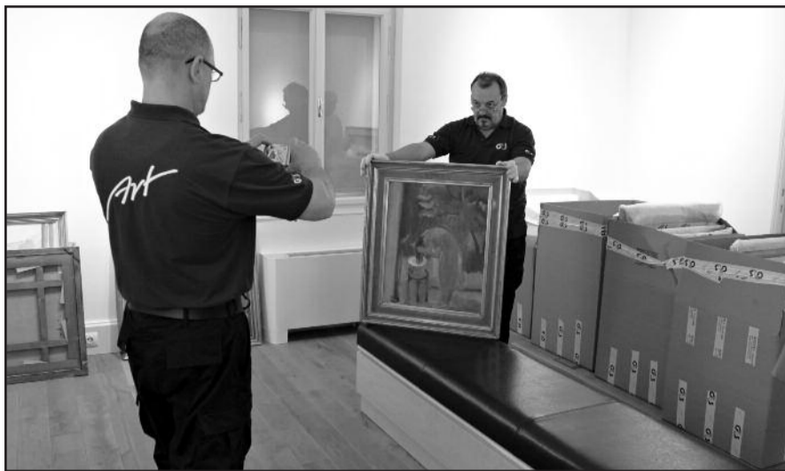
70 festmény több mint 30 helyről érkezett a Vaszary Villa kiállítására

Érdekes, hogy viszonylag sok önarcképet festett, ám ezeken a valódinál mindig törekenyebb testalkatúnak ábrázolta magát, és az 1914-ben készült Konstruktív önarckép című alkotást leszámítva, egyetlen egyen sem látható a szeme. Ady Endre halála után egy évvel elvette feleségül Csinszkát, csaknem másfél évtizedig éltek együtt, a kapcsolatból számtalan remekmű született. Házasságuk mindkettejük számára egyfajta megnyugvást,