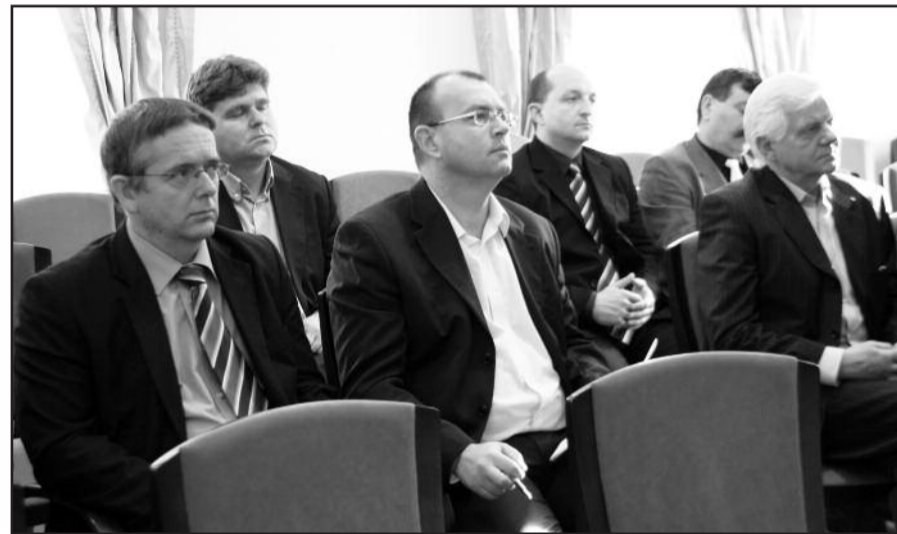
A három megye országgyűlési képviselői a fejlesztéspolitikai tanácskozáson