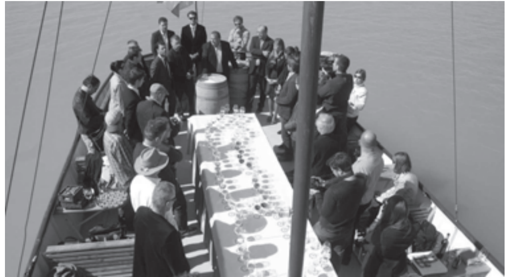
A tó közepére érve az alapítók négy méteres Balaton-sziluetttel raktak ki boraikkal megtöltött poharakból

A Balaton Kör régiós gondolkodásának egyik fontos eleme lesz a