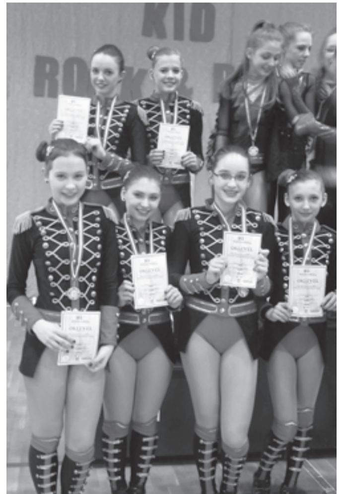
A junior kategóriában induló PárducRock csapat éppen csak lecsúszott a dobogó legfelső fokáról, így egy ezüstéremmel lettek gazdagabbak a Veszprémben megrendezett területi versenyen