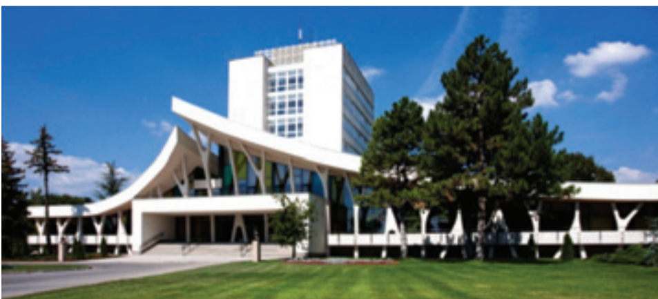
A központ nyáron 3000, a téli időszakban 600 fő befogadására alkalmas.

Zánka jelenleg az újjászületésének időszakát éli. A festői környezetben elhelyezkedő Új Nemzedék Központ újra szeretné felpozícionálni, valódi tartalommal megtölteni Európa legnagyobb ifjúsági komplexumát. Színes programokat, lehetőségeket kínál fiataloknak, családoknak, cégeknek egyaránt. Kiváló színtere lehet kulturális és sportfesztiváloknak, gólyatáboroknak, edzőtáboroknak, egyéni, csoportos üdüléseknek, konferenciáknak.