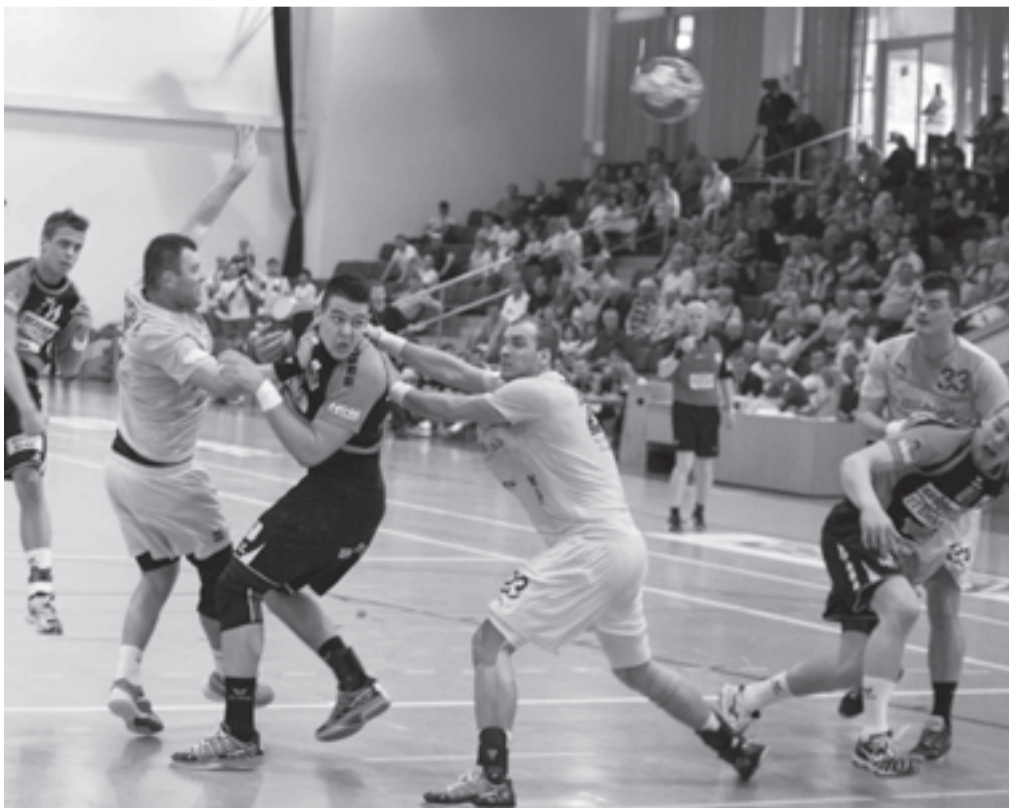
A Balatonfüredi KSE 29:25-re nyerte a harmadik mérkőzését a Gyöngyös ellen, ezzel biztosan bekerült a bajnokság legjobb négy csapata közé. A füriediek legközelebb a Veszprém ellen játszanak

Balatonfüredi KSE–Gyöngyösi Kézilabda Klub 29:25