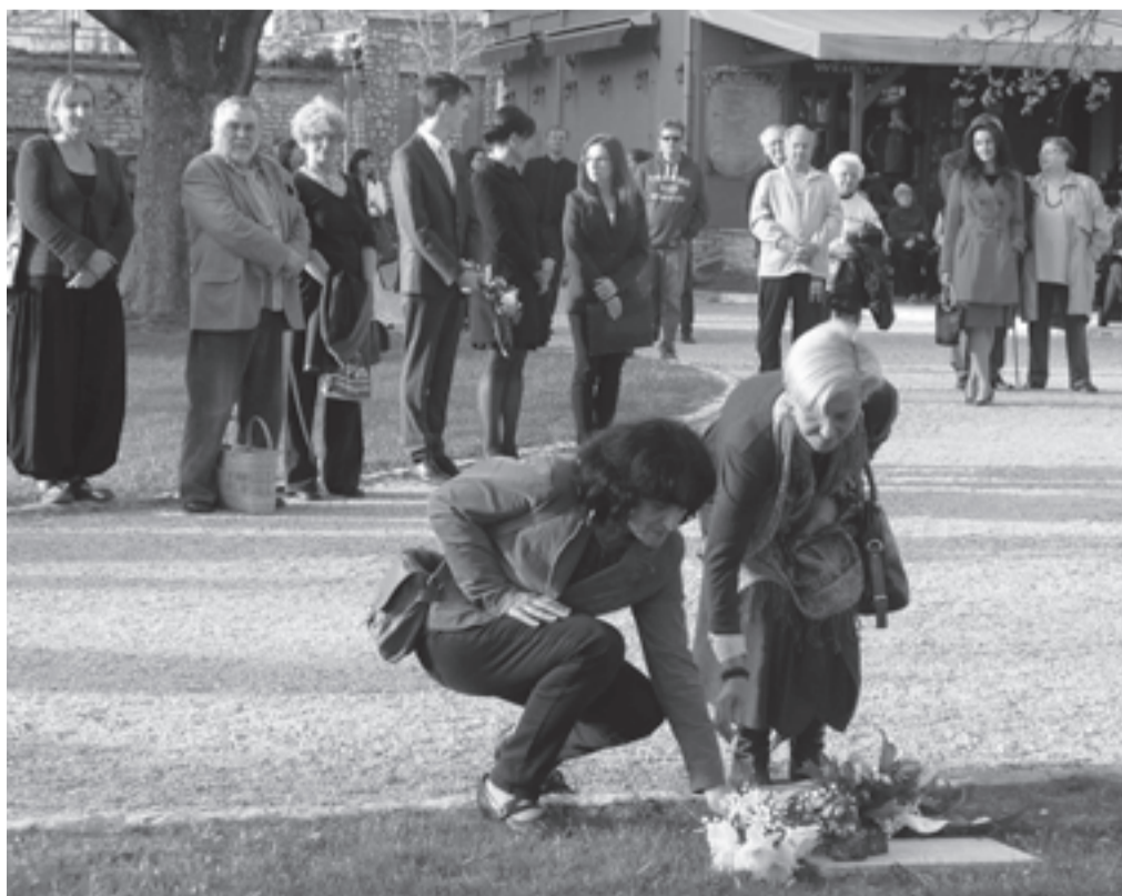
A Hamvas Asztaltársaság minden évben megemlékezik az író-filozófusról a Tagore sétányon

Hamvas Béla író, filozófus 1897-ben született Eperjesen. 1919-ben jelentek meg első irodalmi tárgyú írásai. Bölcsészdiplómája megszerzése után 1923-ban a Budapesti Hírlap és a Szózat újságírója lett. 1927-ben a Fővárosi Könyvtárban helyezkedett el könyvtárosként, ott dolgozott egészen 1948-ig. Ez életének egyik legtermékenyebb időszaka. A II. világháború után egy ideig az Egyetemi Nyomda kis tanulmányai című sorozatot szerkesztette, de 1948-ban sorozatos bírálatai után felfüggesztették állásából. Fizikai munkásként nyugdíjazták 1964-ben. Négy évvel később hunyt el. Életében csupán két esszégyűjteménye jelent meg, munkásságát agyonhallgatták. 1983 után jelenhettek csak meg könyvei. 1990-ben posztumusz Kossuth-díjat kapott.