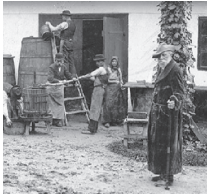
Nekünk a szüretszak a legszebb ünnepünk – írta Jókai sváb-hegyi kertjében, ahol rendszeresen nagy szüretet tartottak

Van egy elfeledett, de az interneten megkereshető kis könyve. Kertészgazdasági jegyzetek a címe. Még 1896-ban összegezte ebben szőlő- és borismereteit. Volt neki bőven, hiszen 1853-ban vette meg a sváb-hegyi telket és házat, s első dolga volt azt paradicsommá változtatni: fákat ültetett, gyümölcsöst telepített és szőlővesszőket ültetett az amúgy nem kedvező talajba. És gondozta ezeket élete végéig, nagyszabású szüretet szervezett. És nagyon nagyra tartotta a borát, de hát melyik borász nincs meggyőződve arról, hogy az övé a legjobb nedű? Herczeg Ferenc írta valahol, aki bejáratos volt az íróhoz kint, a hegyen s lent, a városban, a Bajza utcai lakásába, hogy miközben Jókai itatta vendégeit a maga termelte borral, soha nem