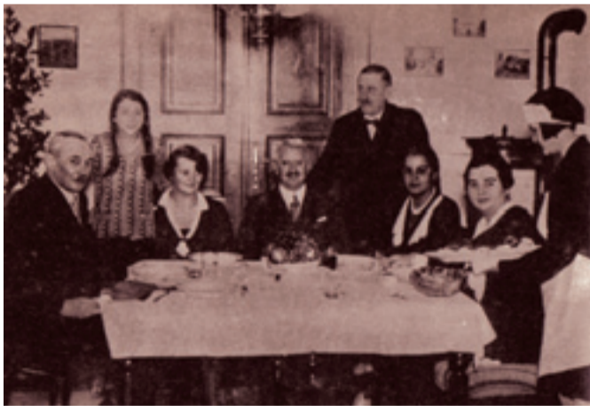
Krúdy Gyula és családja a közös vacsorán

Fordult a világ kereke? A balatonfüredi Krúdy-hívők már nem reggeliznek, hanem vacsoráznak. Egészen pontosan az író születésnapján, október 21-én 18 órától a Blaha Lujza étteremben.