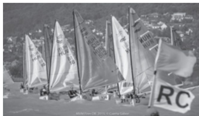
Az utolsó versenynap kedvező szélviszonyokat hozott