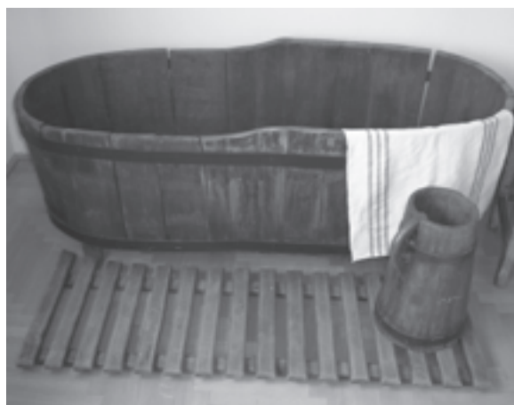
Korabeli fotó a szívkórházról (balra), és a városi múzeumban látható fa fürdőkád