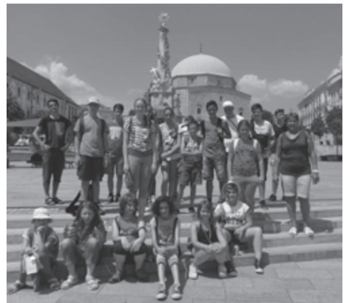
A táborozók körbejárták Pécs nevezetességeit is

Számomra a táborozás mindig is a legjobb szórakozások egyike volt, ami nélkül a nyár nem is nyár. De az idei izményi tábor mégis felülmúlta minden eddigi élményemet. Rengeteg helyen jártunk, és sok mindent