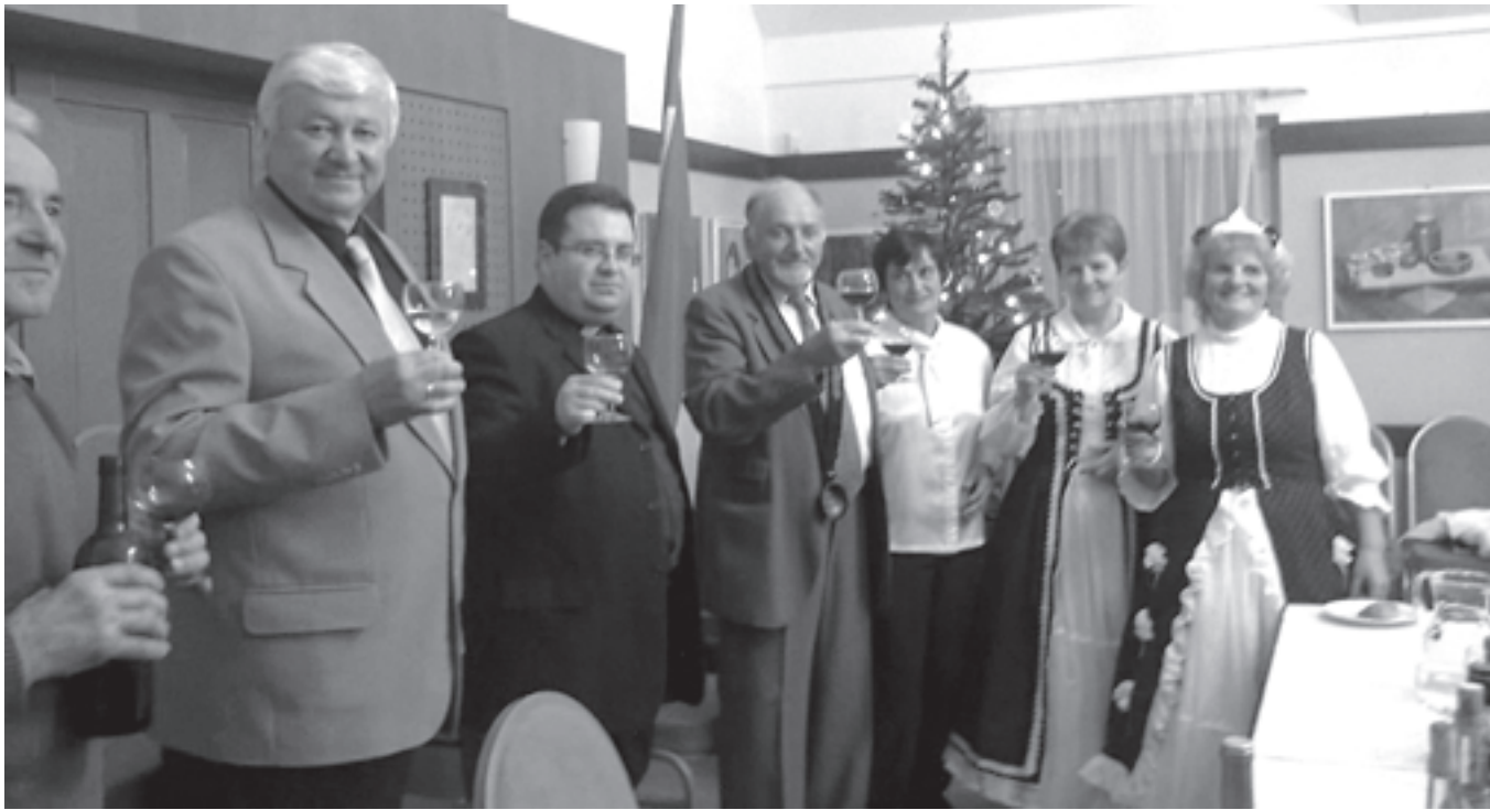
A boráldást követte a disznótoros, február 22-én, farsangkor pedig jelmezben vonulnak fel az arácsiak

Arácson mindig találunk okot az ünneplésre