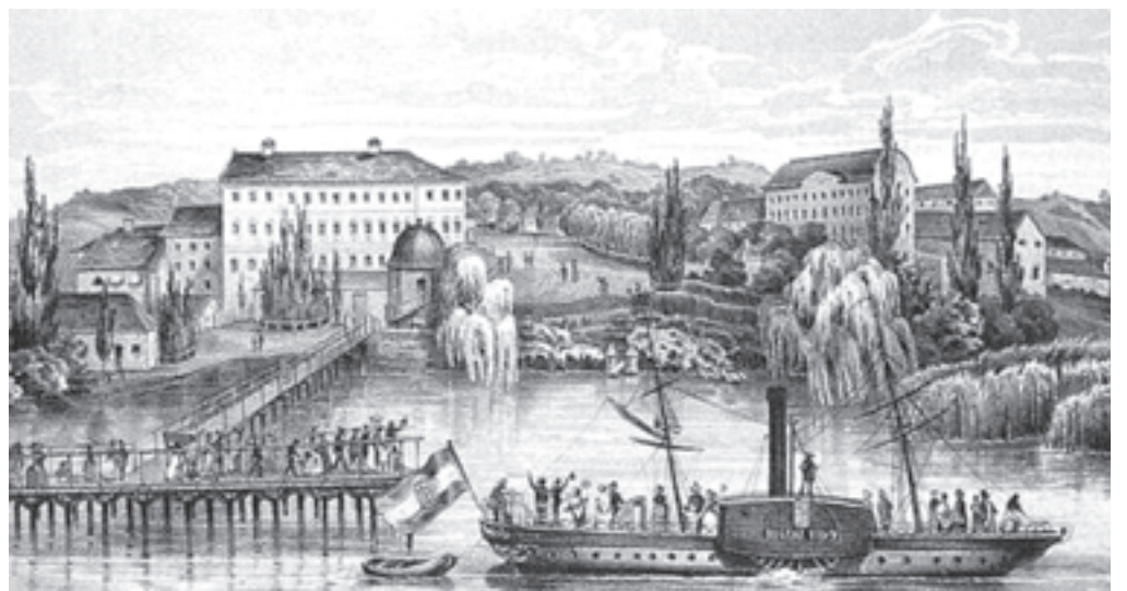
A Kisfaludy gőzös 1846-tól szállította a vendégeket a két part között

Angol lábban – 30,48 cm – számolva, az első Kisfaludy gőzös 50,29 m hosszú, 4,88 m széles és 2,74 m magas volt. A hossz méret valószínűleg a hajótestre vonatkozik, a szélességi méret pedig a főbordán mért vízvonalszélességre. A hajó teljes szélessége – a két oldalkerékkel együtt – legfeljebb 11 m lehetett.