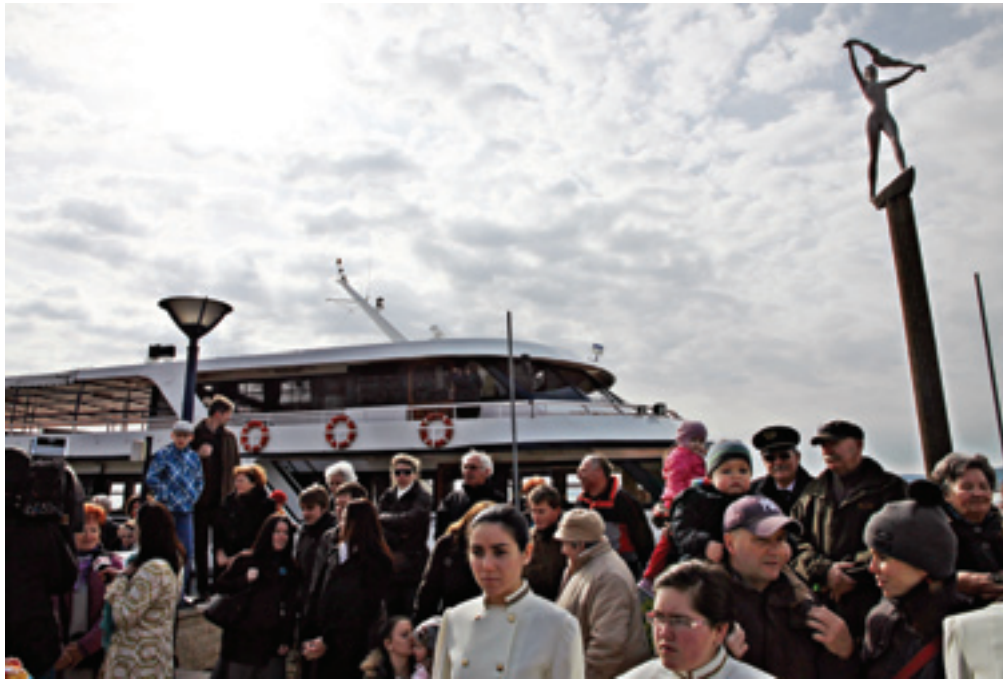
Nagyszombatán ingyen lehetett sétahajózni a legnagyobb baltoni hajóval, a Szent Miklóssal

– Komoly fejlesztési időszak előtt állunk, reményeink szerint több száz millió forint érkezik a Balatonhoz. El kell döntenünk,