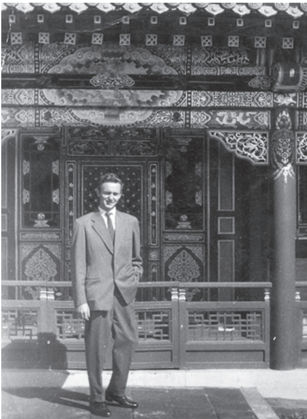
Kádár László három mongol eposzt jegyzett le az utókornak