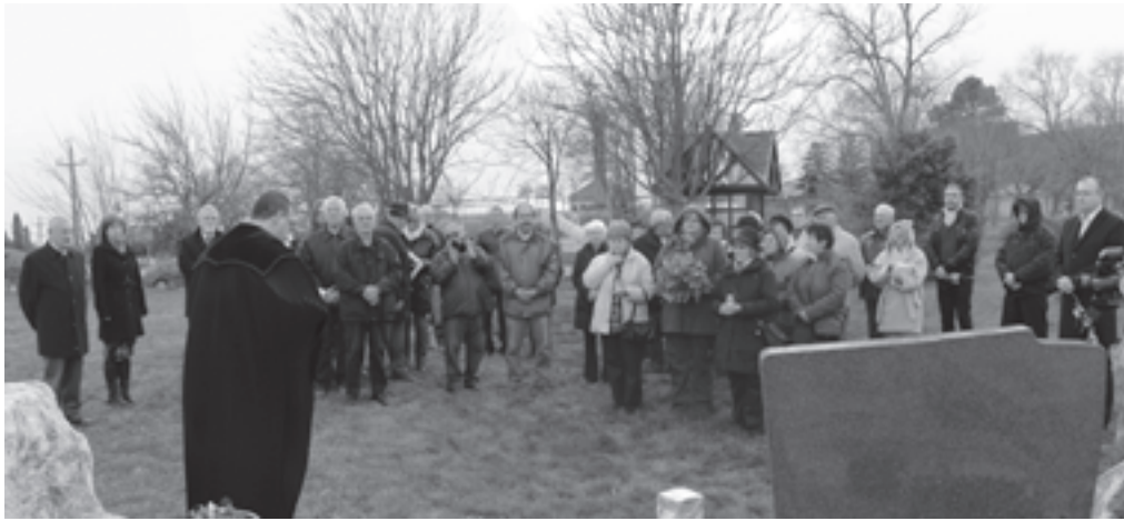
Minden évben a sírjánál is megemlékeznek Kutas Árpádról

A 2010-ben elhunyt Kutas Árpád alpolgármesterre, díszpolgárra emlékeztek Arácscon az Arácsért Közhasznú Alapítvány szervezésében.