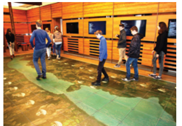
A vitorlástörténeti kiállítás egész évben nyitva tart