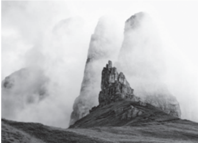
Nagy Tímea fotóin a Dolomitokat örökítette meg