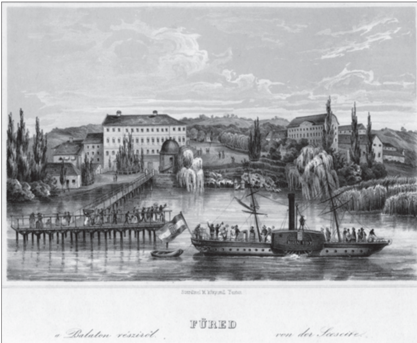
A Balaton-album 1848-as metszetén jól látszik a Kisfaludy gőzös és a jellegzetes füredi épületek

A Balaton Gőzhajózási Társaság alapszabályainak tervezetét