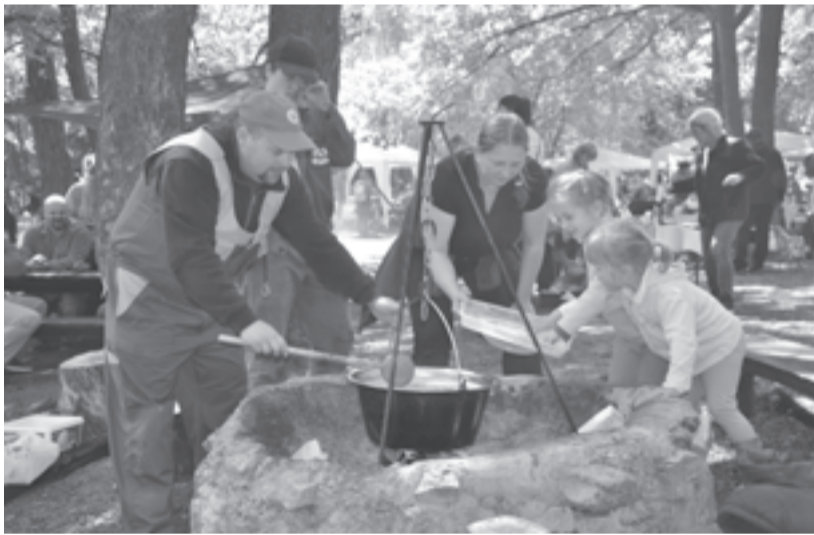
Negyvenöt csapat főzött jobbnál jobb bablevest a Koloska-völgyben

Ahhoz, hogy Jókai – irodalmi jelentősége mellett – immár a város egyik turisztikai hívószava is, nagyban hozzájárulnak a Koloska-völgyi bablevesfőző versenyek. Idén 45 csapat vállalkozott a főzésre, ennyiféle bablevest lehetett kóstolni. A XXIV. Jókai-napok programjaként, ezúttal már 12. alkalommal rendezték meg a nagy közönségsikernek örvendő Jókai-bableves-főző versenyt. A háromfős csapatokat a reggeli eső sem riasztotta el. A legszebb, hogy nincs egyezményes recept, minden induló szabadon választott gyakorlatként fogja fel a főzést, mint ahogy azt az egyik versenyző megjegyezte: itt megtalálható a Jókai-összes. Volt, aki az ara-