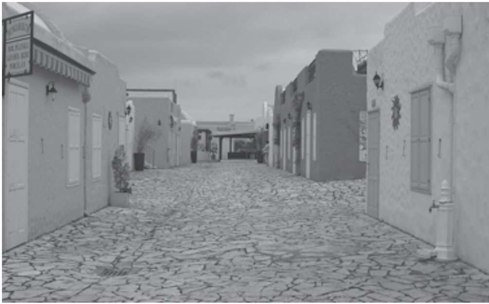
A valamikori görög falut sokféle profillal próbálták már életre kelteni

– Az a tevékenység, amely évek óta zajlik a volt görög faluban, nem érdeke Fürednek. A város megvásárolta a közelben lévő Fürdő Kempinget, ahol minőségi szolgáltatásokat kívánunk nyújtani a vendégeknek, ezzel nem összeegyeztethető a SunCity működése. Az sem mellékes, hogy a kemping révén jelentős bevétel-