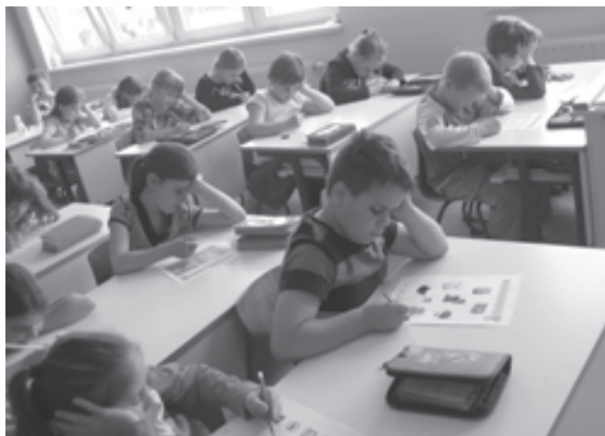
A diákok közlekedésbiztonsági feladatlapokat töltöttek ki