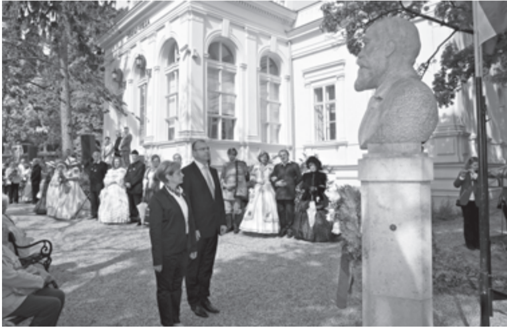
Balatonfüreden élő a Jókai-kultusz, 24. éve emlékeznek meg az íróról egykori villájánál