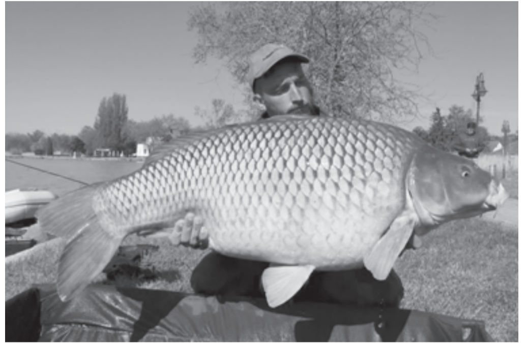
A mérlegelés és a fotózás után ezt a kapitális példányt is visszaengedték a Balatonba

A Balaton pontyállománya hihetetlenül gazdag, az idei évtől életbe lépő horgászrend alapján pedig a behúzásos technikával szinte bármelyik felkészült és rutinos horgásznak sikerülhet megfogni őket. A horgászok a felcsalizott horgokat csónakkal maximum 350 méteres távolságba juttathatják be a partról, ha ezt az érvényben lévő viharjelzési fokozat is lehetővé teszi. Persze a kapás nem érkezik egyik napról a másikra, esetenként több száz kilogramm csalogatóanyag felhasználásával